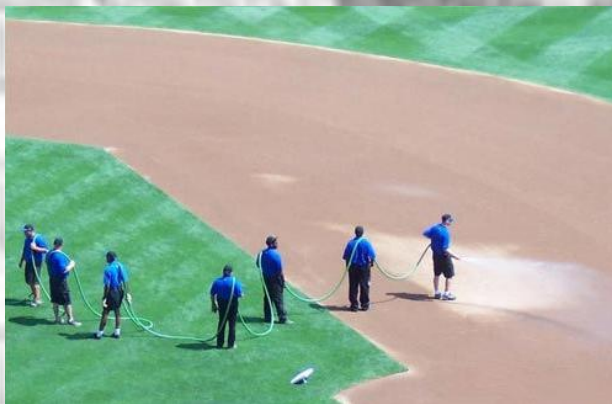
TRAVAIL D'EQUIPE ... OU PAS !?