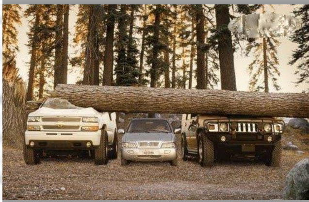
... LA NATURE SE VENGE DE SES ENNEMIS !